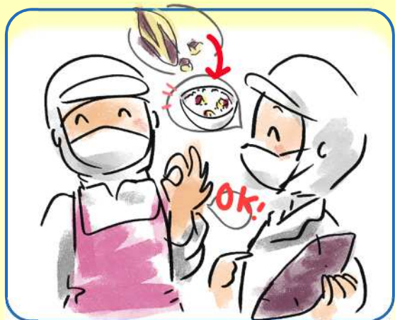
「生きた教材」となる 学校給食の管理