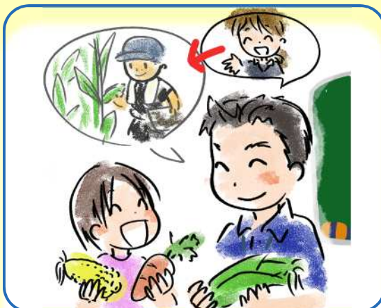
教職員・家庭・地域を つなぐ食育