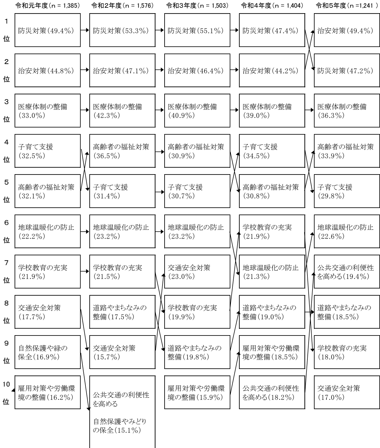
図表4-2 県行政への要望（上位10項目）（複数回答）－過去との比較

過去4年間の調査と比較すると、令和元年度から令和4年度の調査で第2位であった「治安対策」が第1位となり、令和元年度から令和4年度の調査で第1位であった「防災対策」が第2位となった。上位5項目は、令和元年度以降同じ項目となっている。(図表4-2)