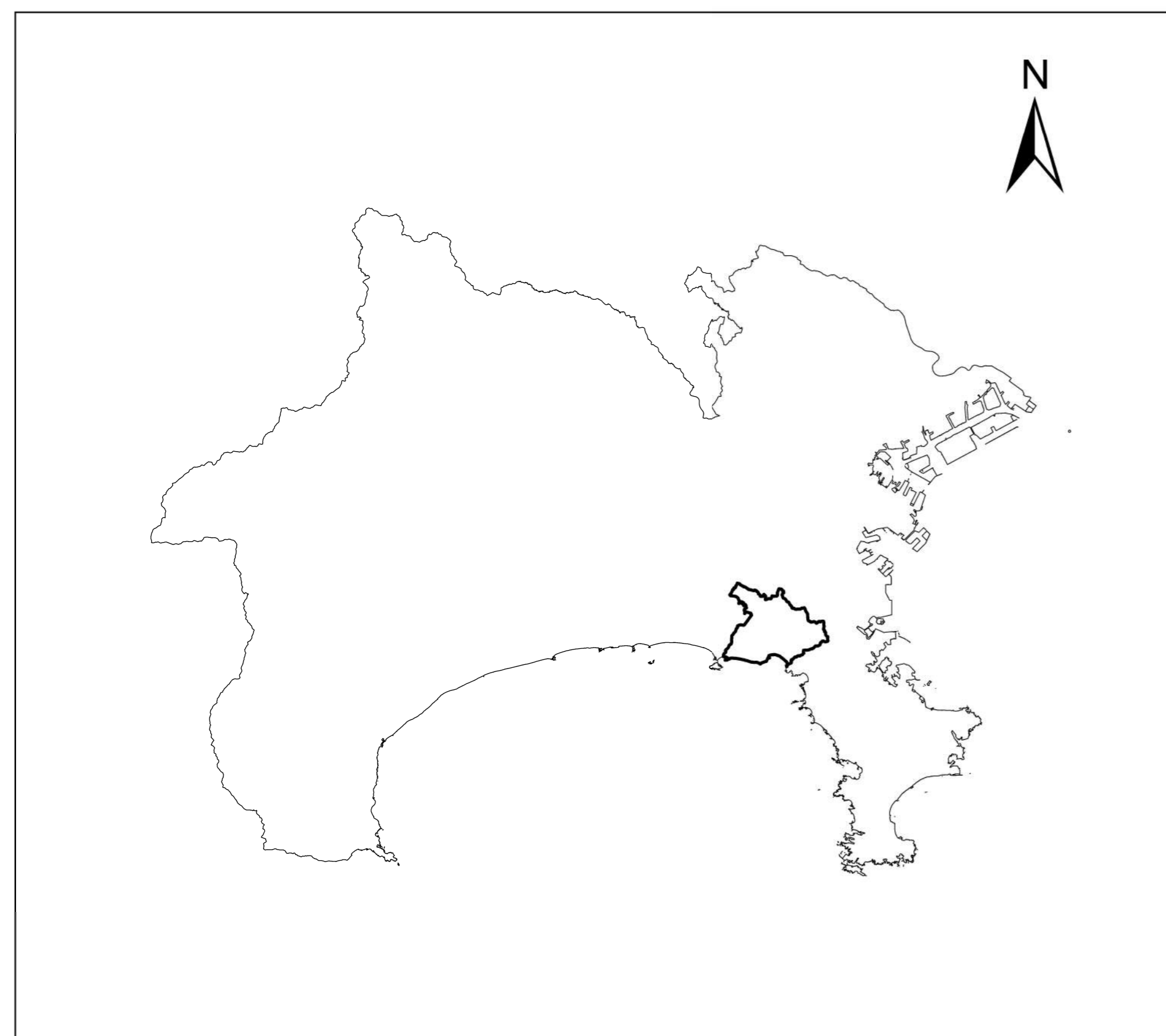
全体位置図 (S=1:500,000) (A2)