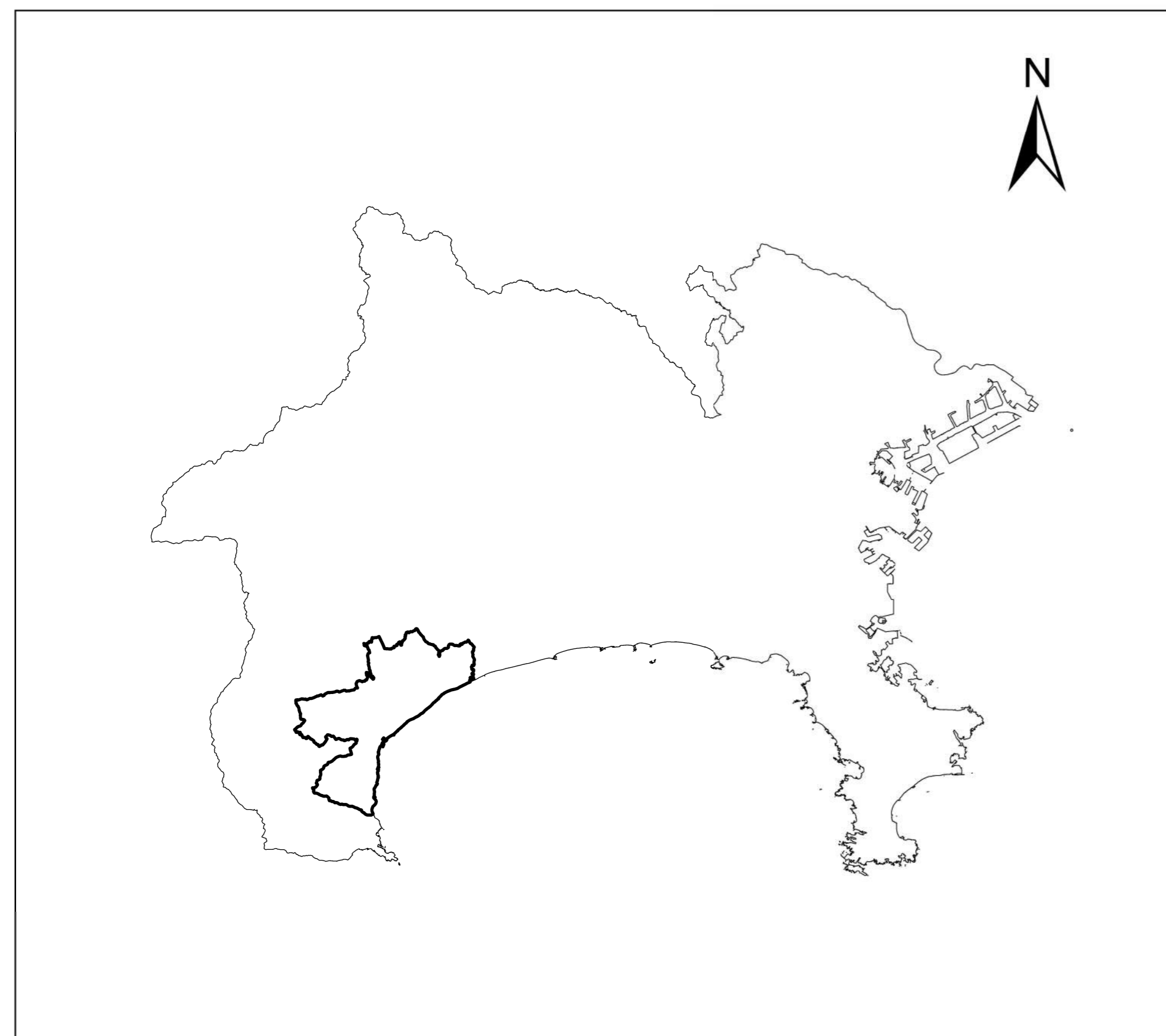
全体位置図 (S=1:500,000) (A2)