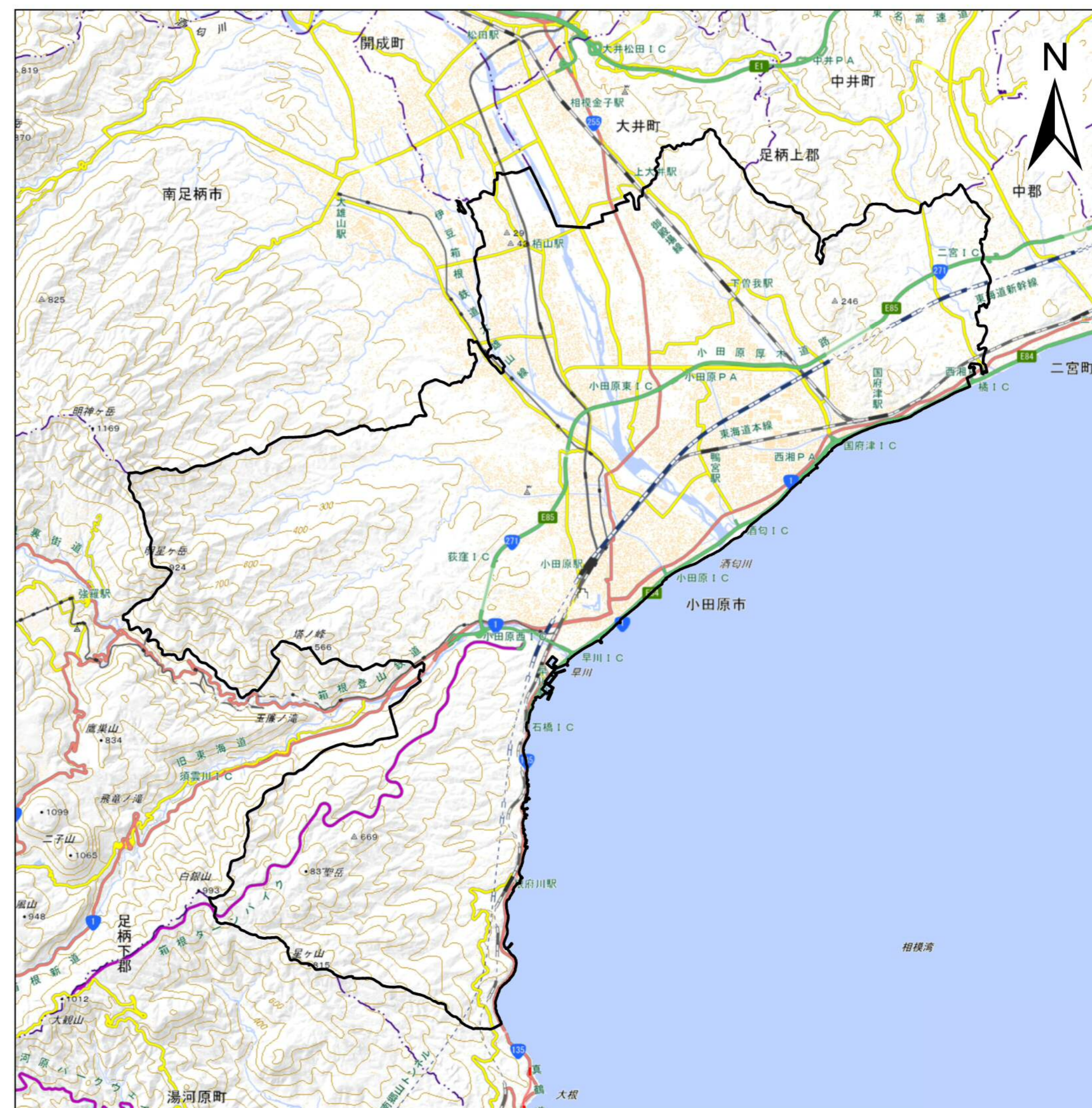
詳細位置図 (S= 1:90,000) (A2)