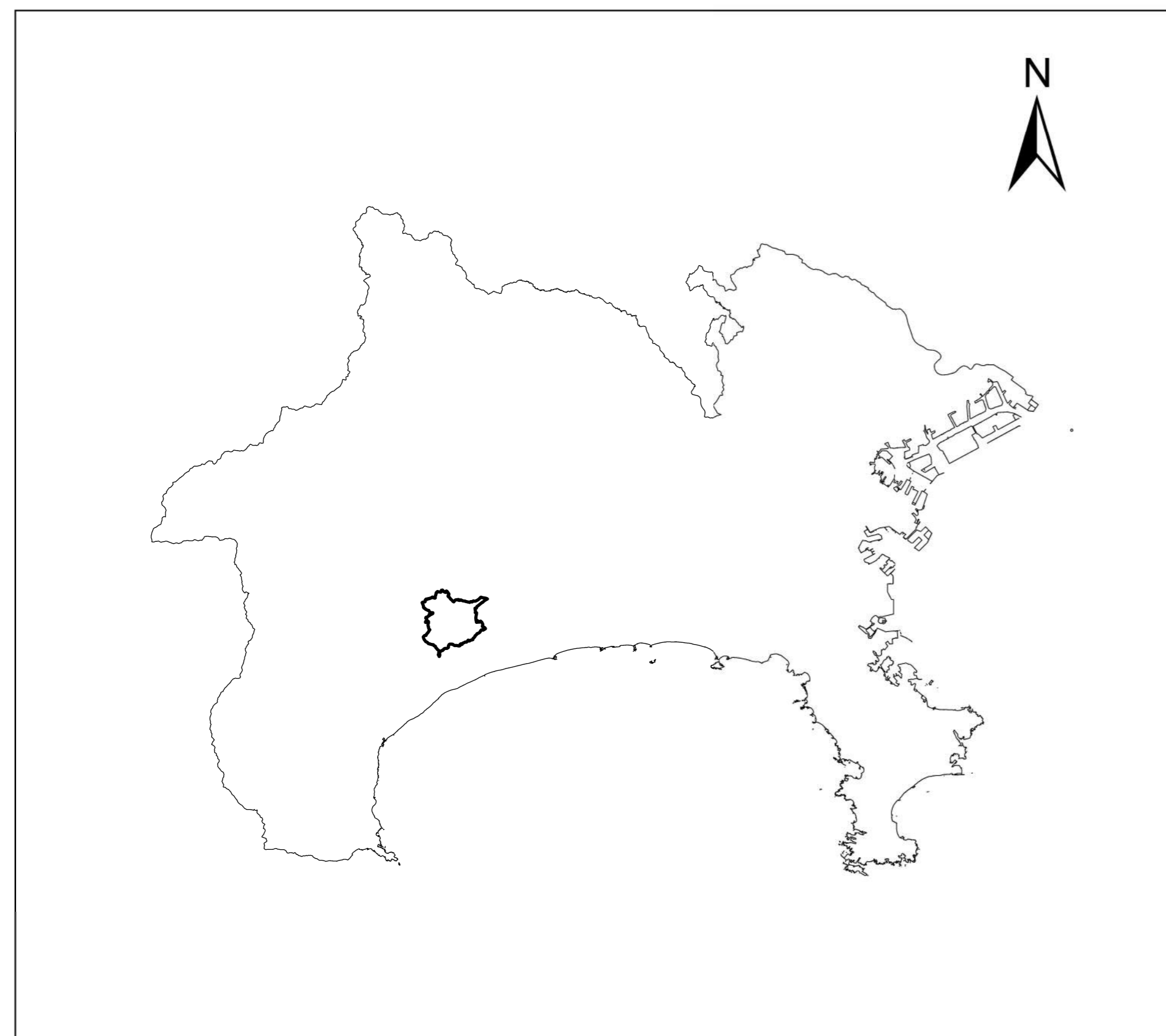
全体位置図 (S=1:500,000) (A2)