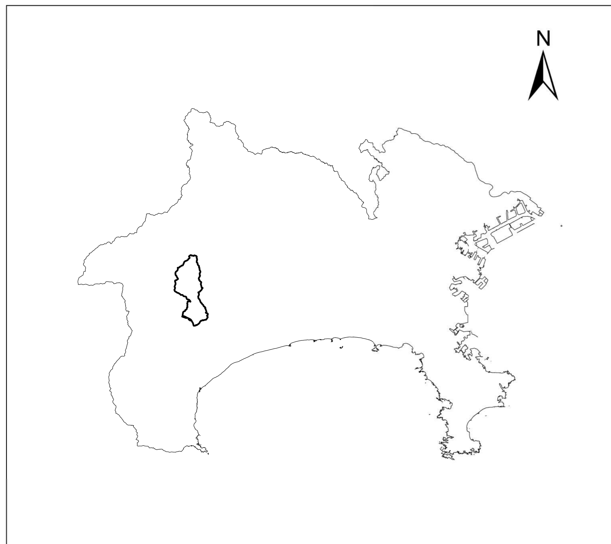
全体位置図 (S=1:500,000) (A2)