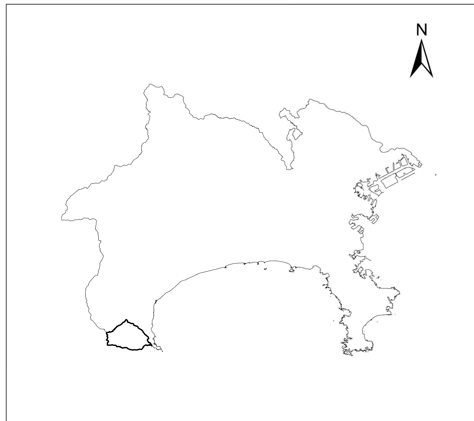
全体位置図 S=1:500,000 (A2)