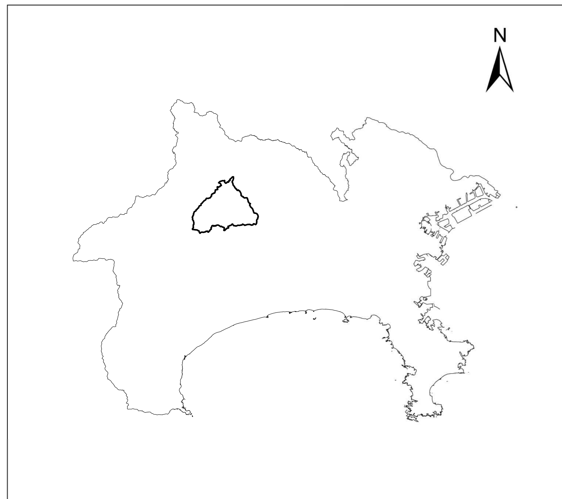
全体位置図 (S=1:500,000) (A2)