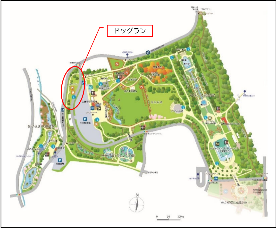
相模原公園平面図