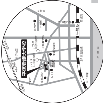
平塚看護大学校周辺案内図