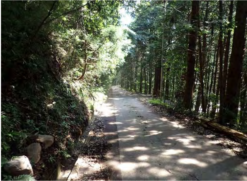
③保全対象 川入林道