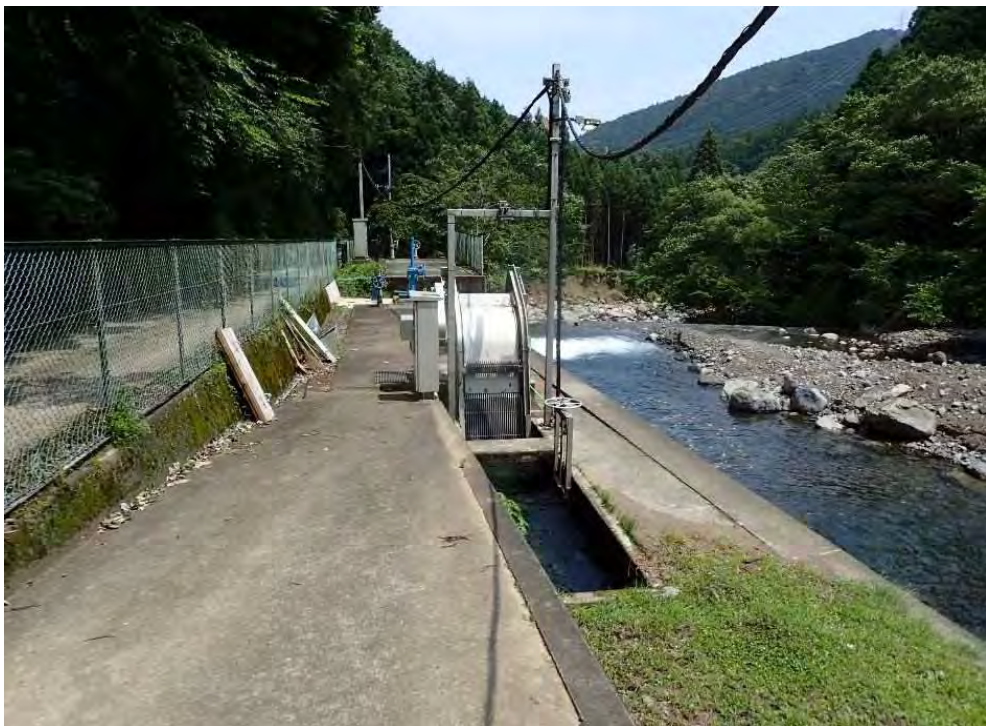
⑧保全対象 取水口（4工区直下）