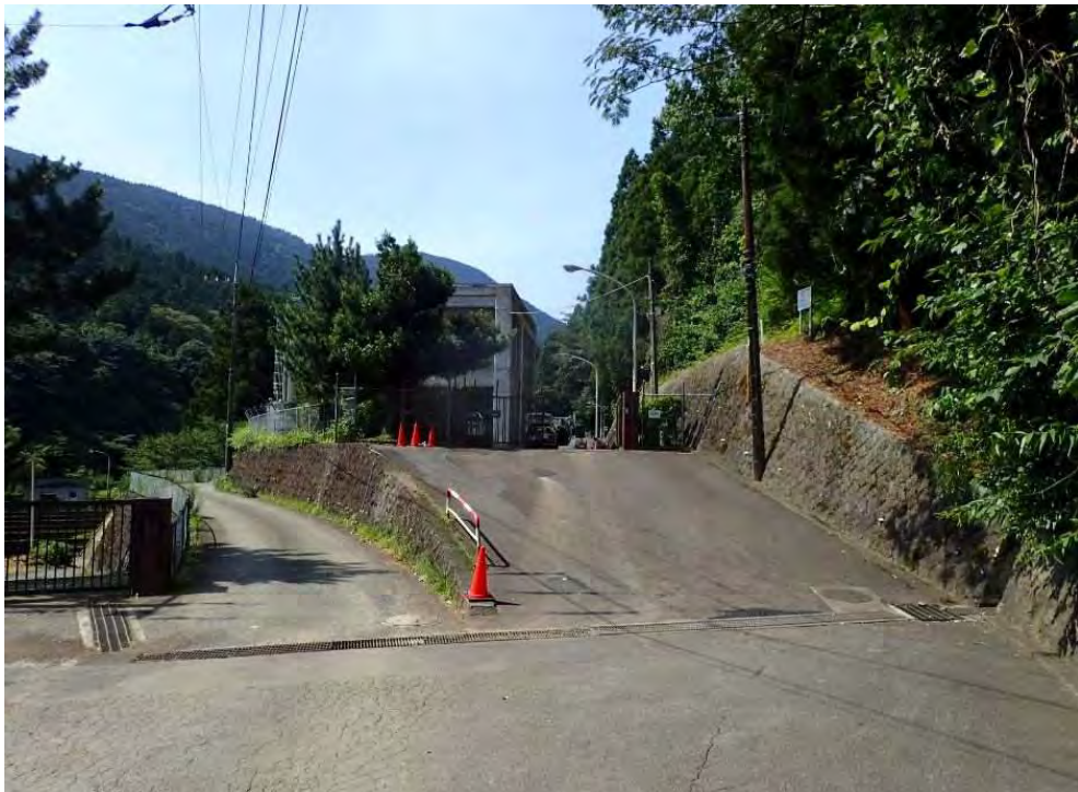
⑥保全対象 矢倉沢上浄水場