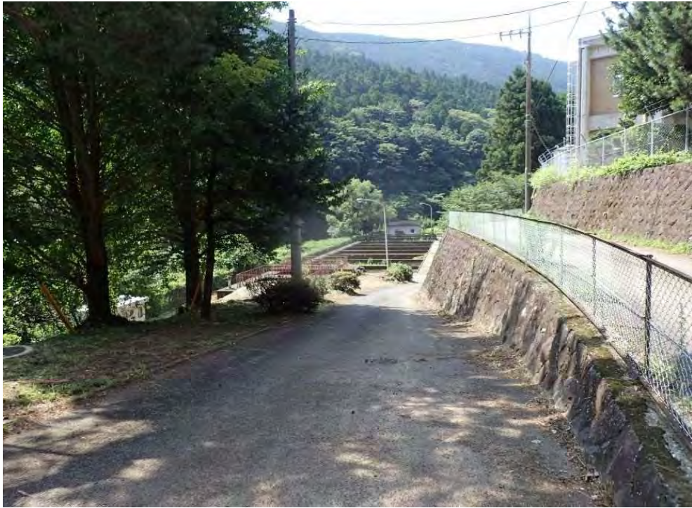
⑦保全対象 矢倉沢貯水槽