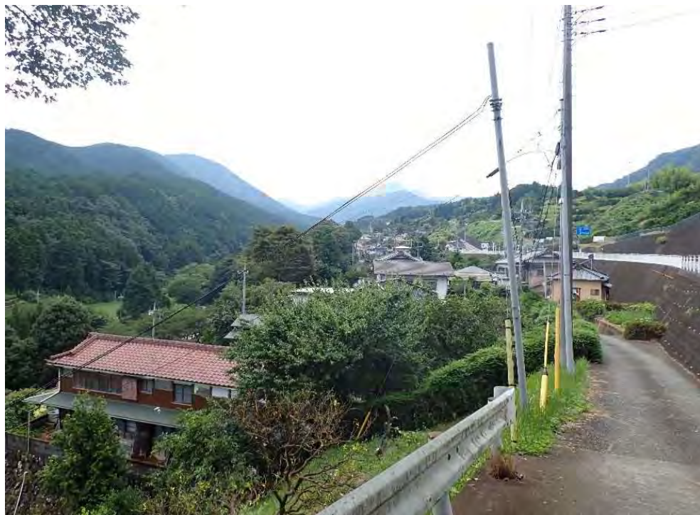
①保全対象 矢倉沢集落 人家16戸