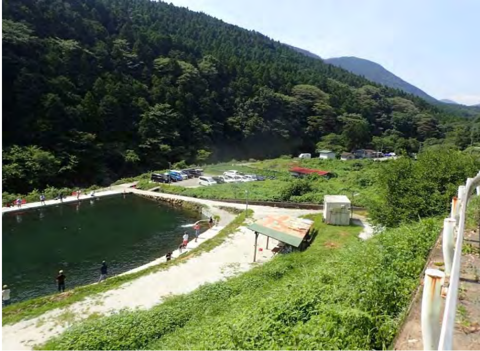
⑤保全対象 マス釣り場