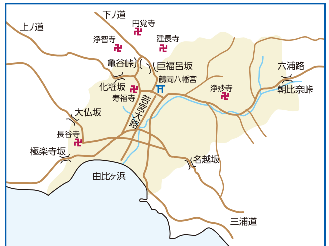
かながわの古道(神奈川合同出版)より

関東一円から相模国・大山阿夫利神社(現:伊勢原市)へ向かう参道です(江戸時代)。かつて大山信仰が隆盛を極めていた頃は、関東の道はすべて大山に通じると言われ、東北・東海地方へと広がっていました。これらの道は、信仰の道であるとともに地域の生活道でもあり、その道筋は時代により変わっていきました。大山道には大山講などに献納された石灯ろうや不動尊蔵が建てられており、台座などに刻まれた道しるべが人々を導いています。現在では国道246号等に引き継がれ、主要幹線道路として重要な役割を果たしています。