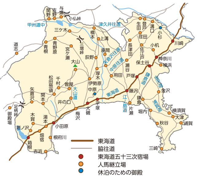
神奈川の東海道(上)(神奈川県東海道ルネッサンス推進協議会)より