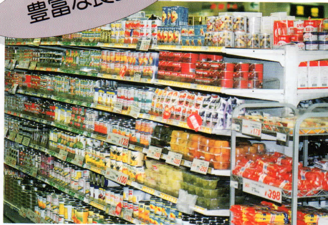
▲スーパーの食品売場などには多種多様な食品が並んでいる。