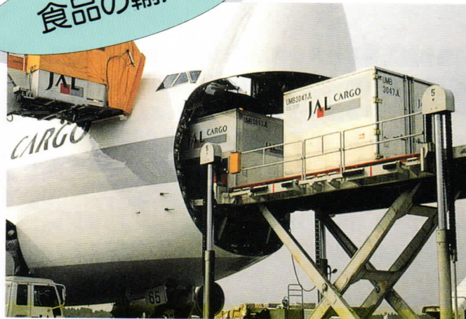
▲毎日のように海外からカーゴ便などで食品が輸入されている。