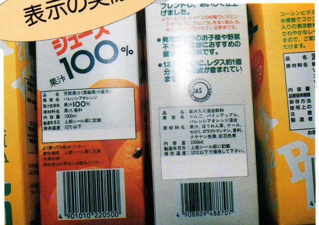
▲食品の表示は、食品衛生法のほか、JAS法（日本農林規格）などの法令により定められている。