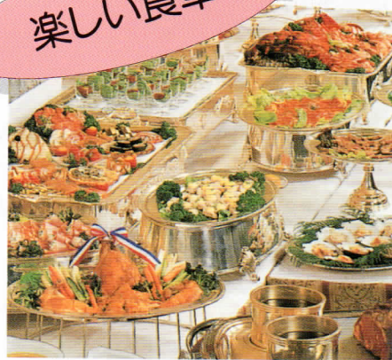
▲いろいろな食品が食卓を飾る。