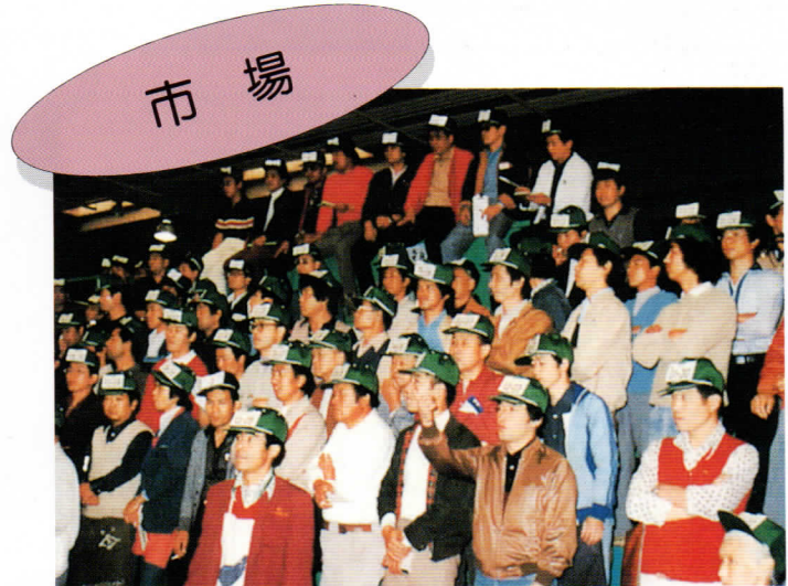
▲輸入されたオレンジは青果市場で競（せ）りにかけられる。