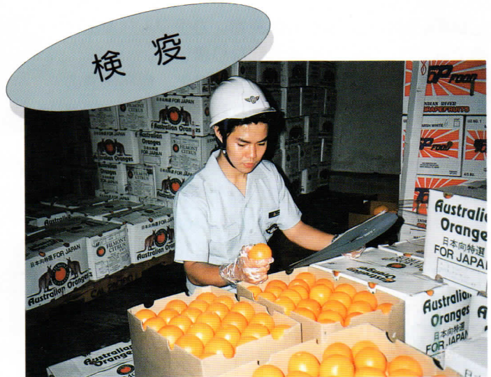
▲厚生省横浜検疫所による監視指導。

このように、国ではいわゆる水際の監視（検疫）を行っています。輸入後の食品については、保健所が県内の流通食品や県内で製造される食品と同様に監視や検査を行います。