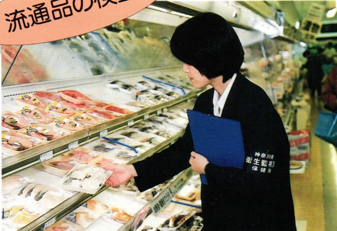
▲スーパーの売り場で検査をする保健所の食品衛生監視員。

保健所では、スーパーなどの販売の段階でも食品の表示点検や抜き取り検査などを行います。