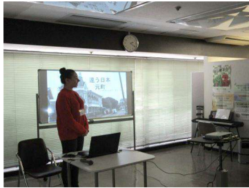
ロシアの留学生の発表