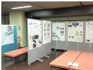
“留学生がみたかながわ”ポスター展