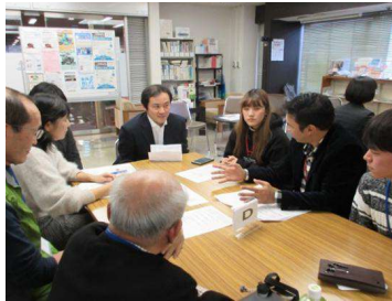
グループ交流の様子