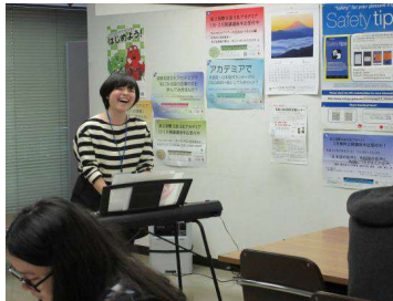
“かながわに因んだ歌”を楽しむ