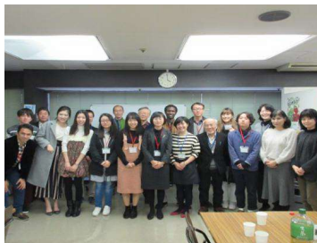
交流会参加者で記念撮影