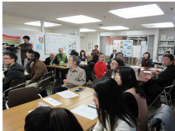
留学生の発表を聞く参加者