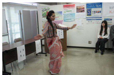
留学生によるネパール舞踊