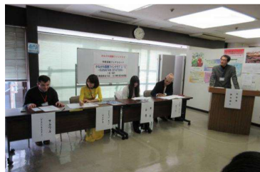
4ヶ国のパネラーと司会者