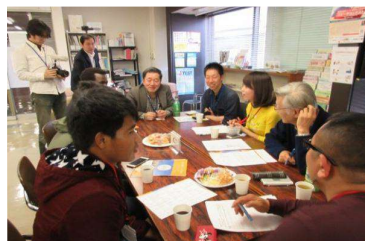
各国・グループ別交流会の様子