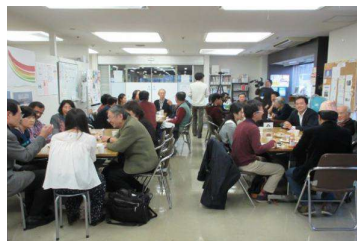
各国・グループ別交流会・全体の様子