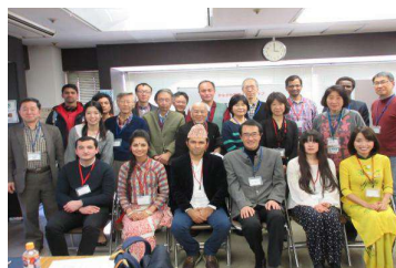
交流会参加者で記念撮影