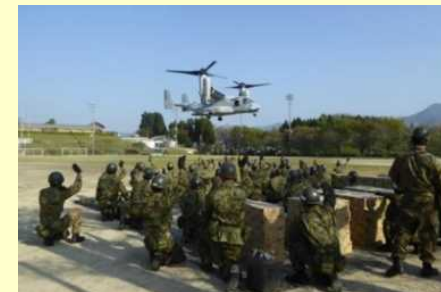
南阿蘇村で生活物資等を輸送する米軍オスプレイ