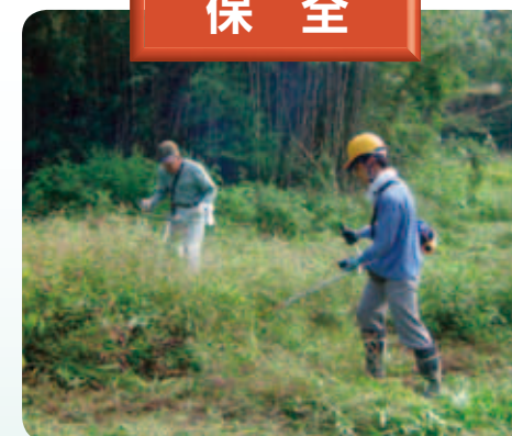
荒廃農地での草刈り