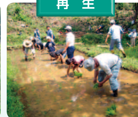
復元した水田での田植え