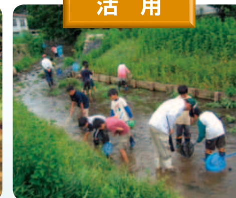
小川での生き物調査

里地里山とは、集落と農地・水路・ため池・雑木林などが一体となった地域です。こうした地域は、人が「自然」に働きかけ、長い時間をかけて形づくられており、農林業の生産の場や生活の場として、私たちに多くの恵みをもたらしてきました。しかし近年、生活様式の変化や農家の減少・高齢化などを背景に適切な管理が行き届かず、その恵み多き機能が失われつつあります。県では、「里地里山」を次世代へ引き継いでいくため、保全・再生・活用の促進について条例を定めました。