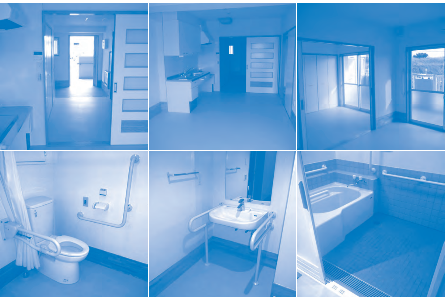
※新築住宅は完成後の仕様が一部異なる場合があります。