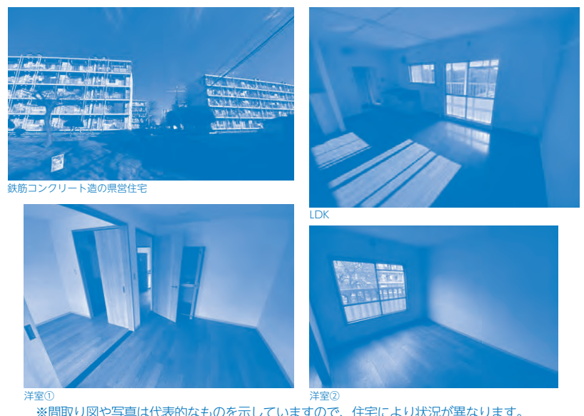
※間取り図や写真は代表的なものを示していますので、住宅により状況が異なります。