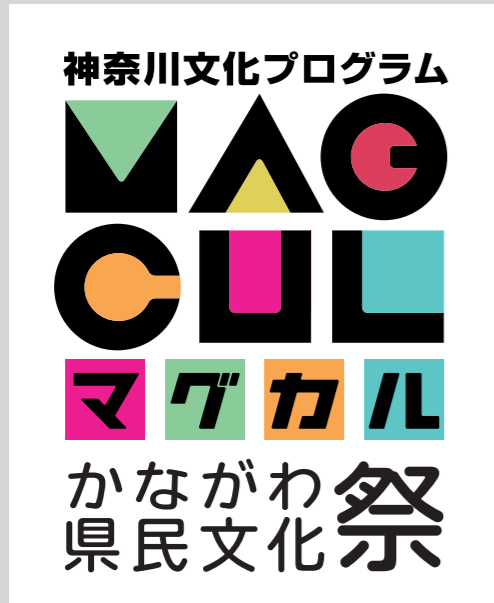
[01-color/ 余白 BOX あり]

◎写真などの上に配置するような見えづらい状況では、「余白 BOX あり」をご使用ください。