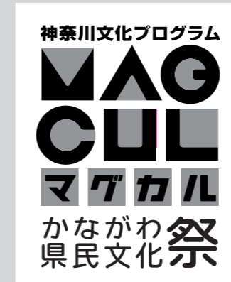
[02-mono-A/ 余白 BOX あり]