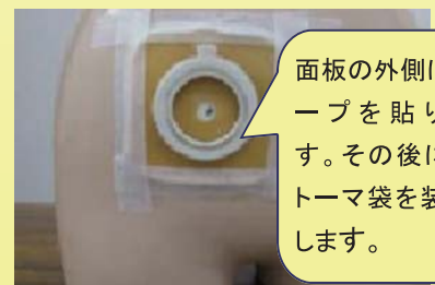
⑤全面皮膚保護剤の場合