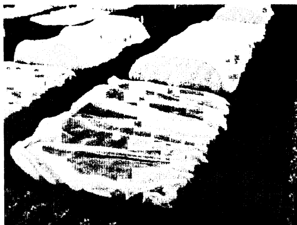
第2図 コマツナの春どり作型栽培試験における各被覆資材処理区の設置状況。

平織り資材 (SLN) を用いたときの事例。黒い点はネットの目から脱出しようとしているキスジノミハムシ。