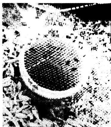
第1図 キスジノミハムシの通過性測定方法

平織り資材 (SLN) を用いたときの事例。黒い点はネットの目から脱出しようとしているキスジノミハムシ。