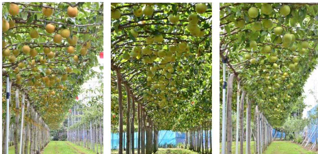
図3 現地実証圃場における各品種の着果状況 (左から, 8年生‘筑水’, 6年生‘秋麗’, 5年生‘なつしずく’)

‘秋麗’は 194 kg/10a, ‘なつしずく’は 221 kg/10a となり, 前年と同程度の収量であった(図1)。果実品質では, ‘なつしずく’のジョイント区は2本主枝区と比較して糖度がやや低かった(表1)。