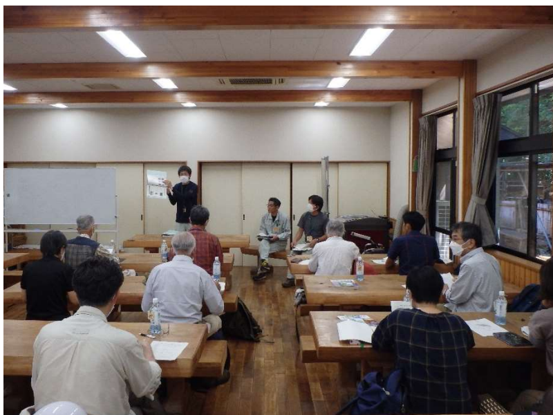
▲ 秦野市による地域水源林整備状況の説明