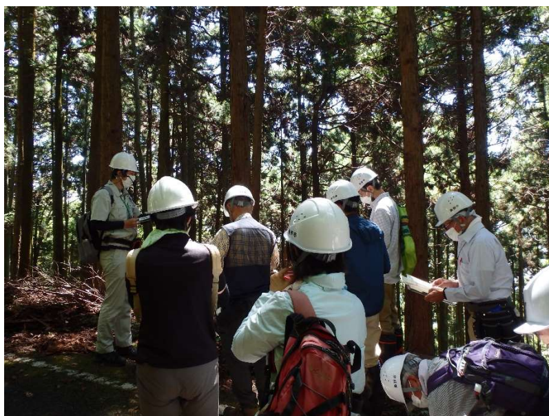
▲ 現場視察（羽根A地区）の様子