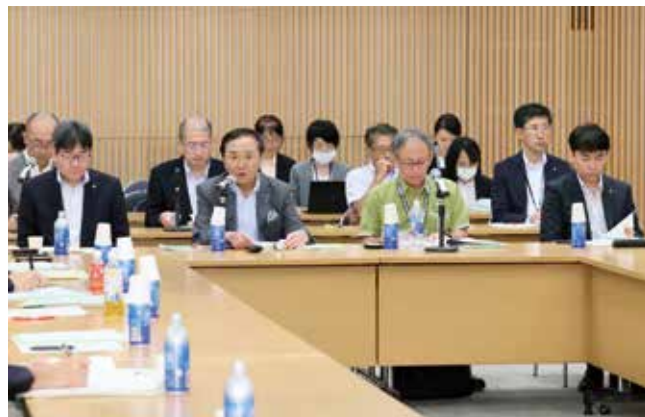
令和5年度定期総会(前列左から青森県副知事、神奈川県知事、沖縄県知事、長崎県副知事)