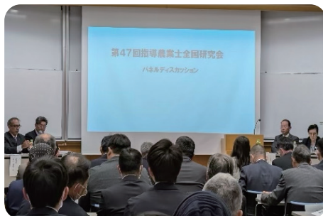
指導農業士全国研究会