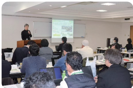
農政研究会 (県担い手育成事業との共催)