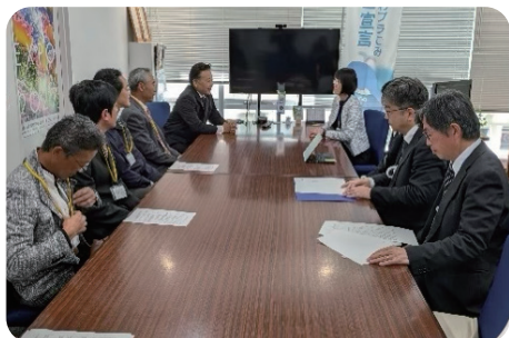
県幹部との意見交換会