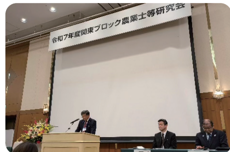
関東ブロック農業士等研究会