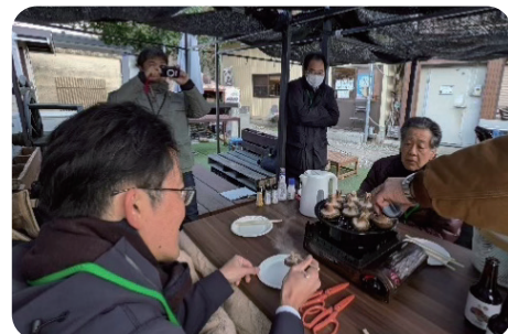
若手農業者等との交流会