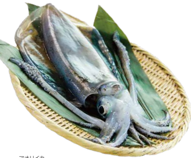
アオリイカ (撮影地: 平塚市漁業協同組合)