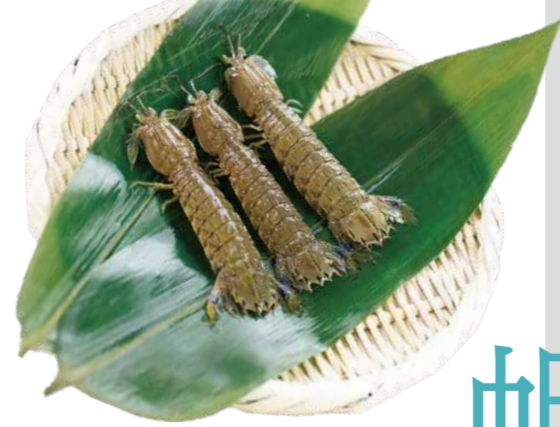
シャコ (撮影地:横浜市漁業協同組合)