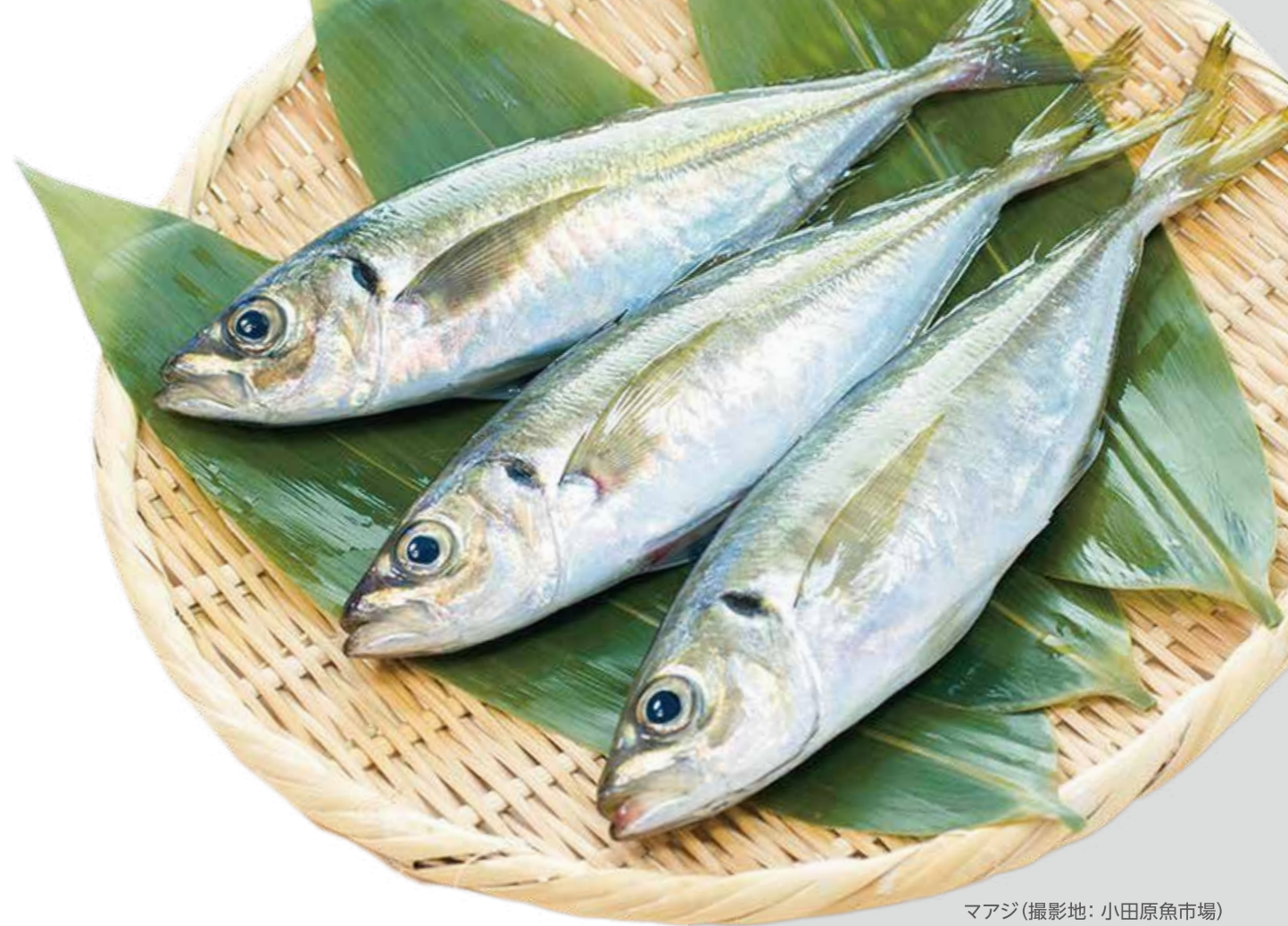
マアジ (撮影地: 小田原魚市場)