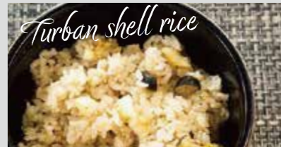
サザエご飯 (撮影地: 三和漁業協同組合城ヶ島支所)