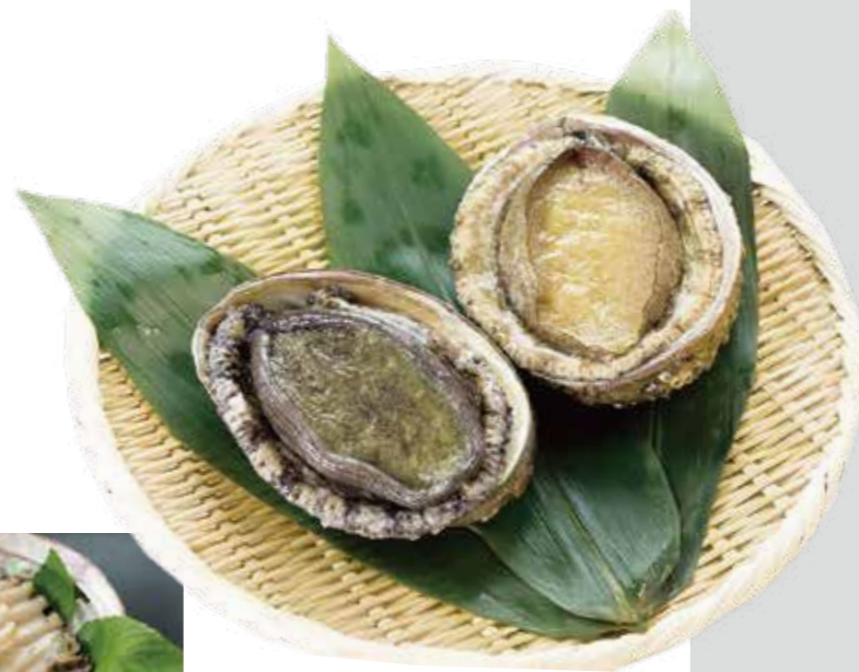
クロアワビ・メガイアワビ (撮影地: 三和漁業協同組合城ヶ島支所)