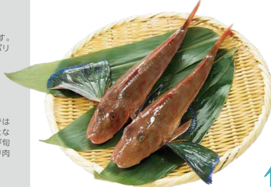
ホウボウ (撮影地: 平塚市漁業協同組合)

ほぼ周年漁獲されますが、小型底びき網では春から夏が、刺網では冬が主な漁獲時期となります。煮付けの食材としては卵を持つ冬が旬といえますが、脂が乗るのは夏で、よく太り肉厚になります。