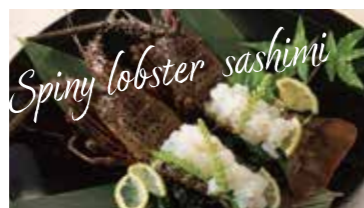
イセエビのお造り