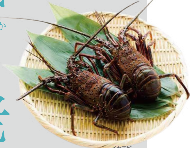
イセエビ (撮影地: 湘南漁業協同組合鎌倉支所)

イカ類では最高級と評価され、そのやわらかい身と甘みで大変おいしいアオリイカ。餌木と呼ばれる和製ルアーによる釣りでも大変人気のあるイカです。