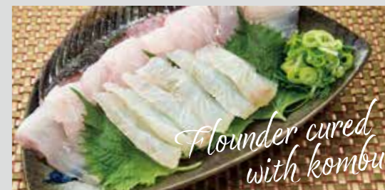
ヒラメの刺身、昆布じめ

冬場のヒラメは「寒ヒラメ」とも呼ばれ、脂が乗って非常に美味です。ヒラメはエビ類から小型の魚まで、さまざまな魚介類を餌としていますが、それらの餌で育ったヒラメは、たっぷり栄養を蓄えています。また、ヒラメはマダイと並ぶ白身魚の代表的な存在です。しっかりと締まった身質で、くせがありません。「えんがわ」はヒラメ1尾からわずかしか取れず、弾力がありうまみと甘みが凝縮されているため珍重されています。