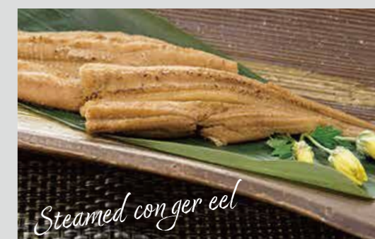
蒸しアナゴ(撮影地: 小柴のどんぶりや)

アナゴの仲間は神奈川県沿岸でも数種類見られますが、食材としては何と言ってもマアナゴでしょう。東京湾のマアナゴは、江戸前を代表する食材のひとつです。アナゴは柔らかな身にほどよい脂肪があります。特に、梅雨時にはふっくらと身が厚くなり、食べ頃となります。