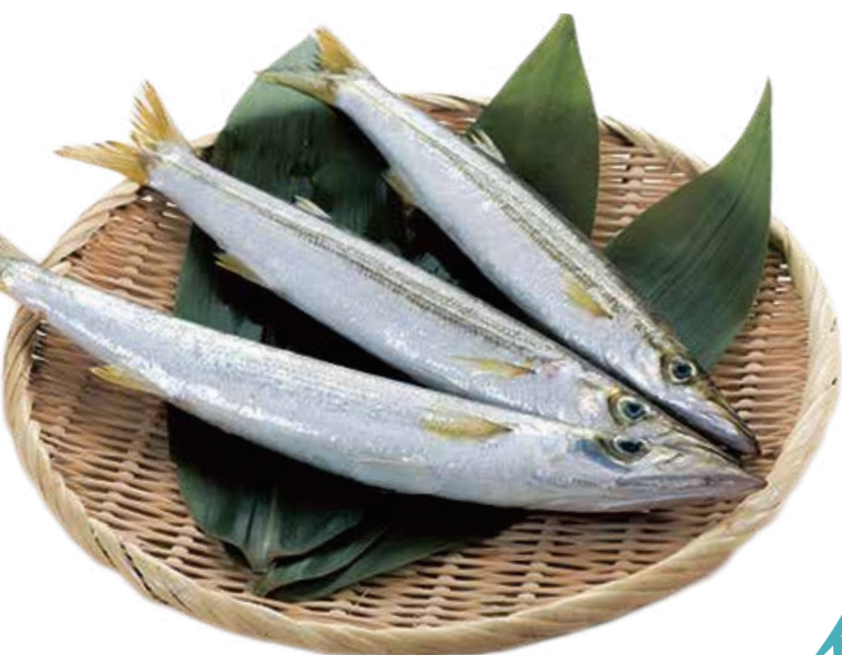
アカカマス (撮影地: 平塚市漁業協同組合)