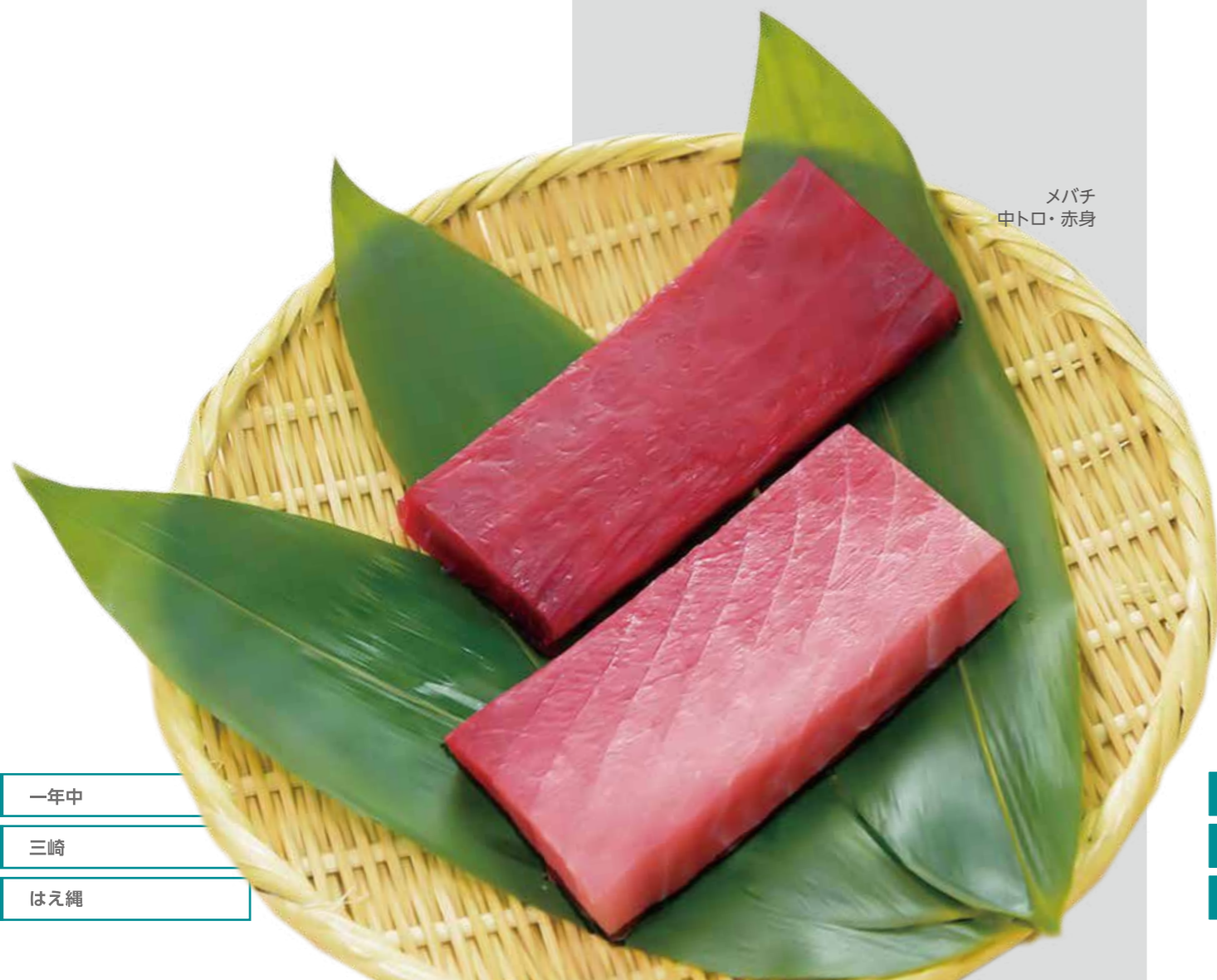
メバチ 中トロ・赤身