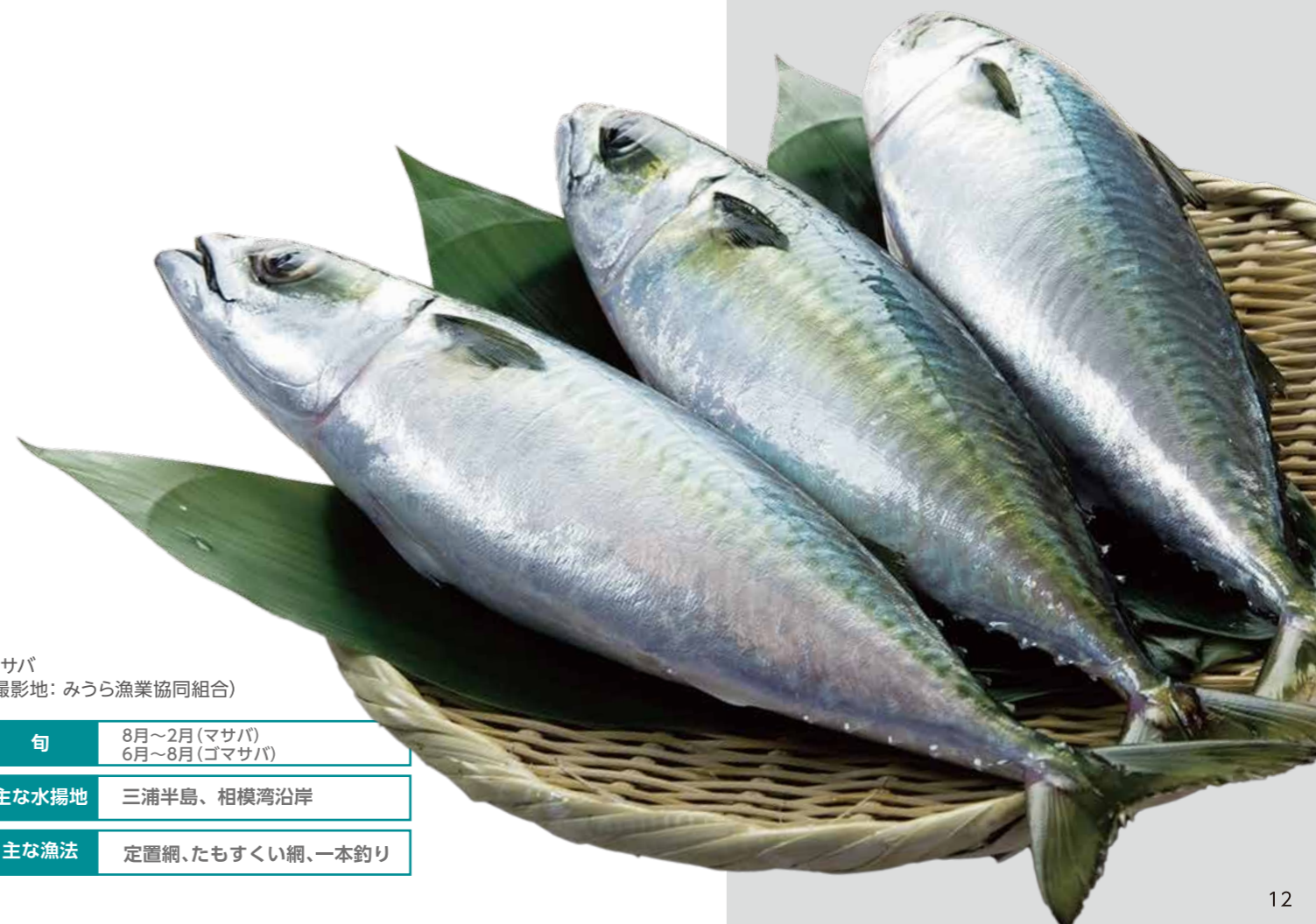
マサバ (撮影地: みうら漁業協同組合)