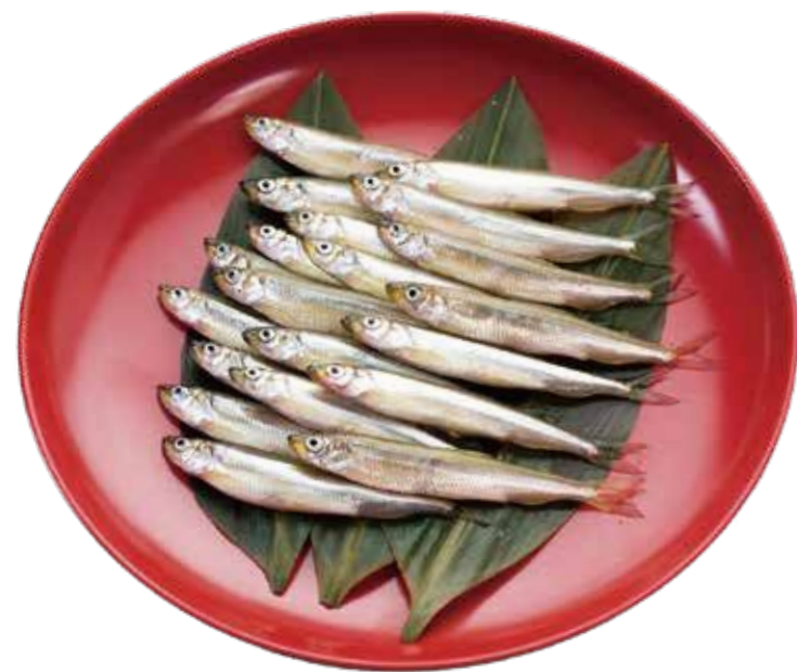
ワカサギ(撮影地: 芦之湖漁業協同組合)

ヒジキは潮間帯に生育しています。春先に収穫され、釜で蒸し、天日干しで乾燥させて製品となります。