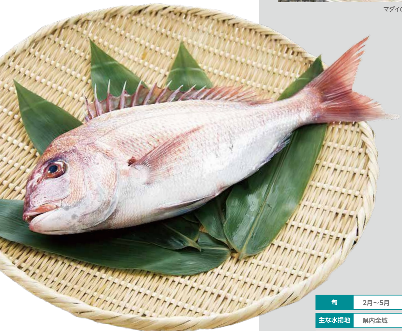
マダイ (撮影地: 横浜市漁業協同組合)

おすすめの食べ方 刺身、塩焼き、鯛めし、煮物、カルパッチョなど、食べ方は様々です。特に、タイの皮目に熱湯をかけて、皮を縮ませる「松皮造り」は、皮の持つゼラチン質と食感を生かした料理方法で、タイのうまみと風味が深く味わえます。