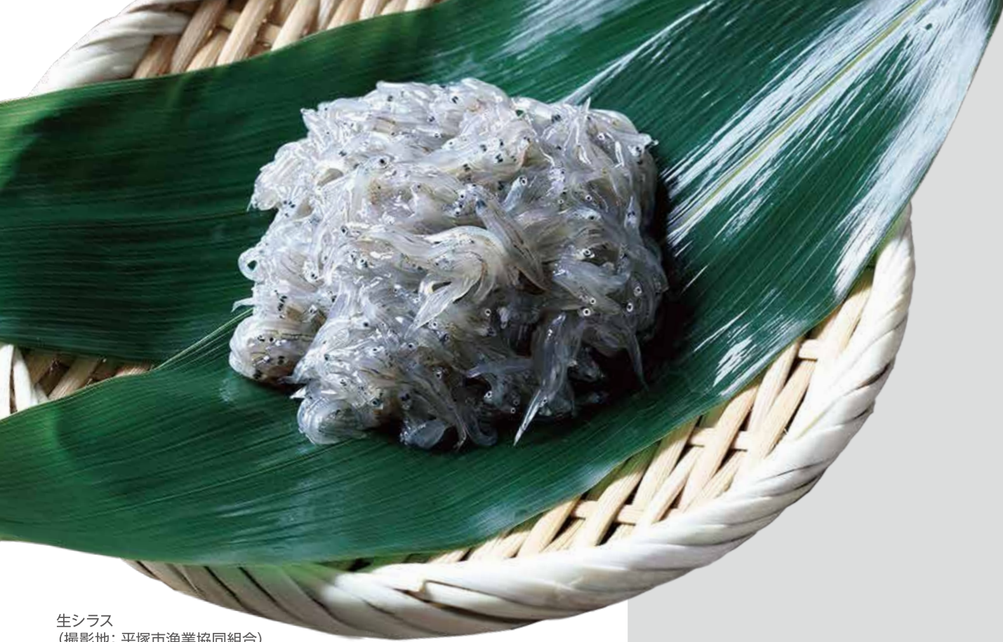
生シラス (撮影地: 平塚市漁業協同組合)