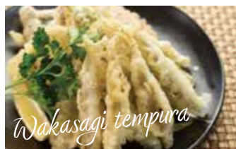
ワカサギの天ぷら

県内の湖では、初秋から晩冬にかけてワカサギのボート釣りを楽しむことができます。ワカサギで特に有名なのが芦ノ湖で、毎年10月1日にワカサギ刺網漁が解禁され、その初漁のワカサギは宮内庁に献上されています。