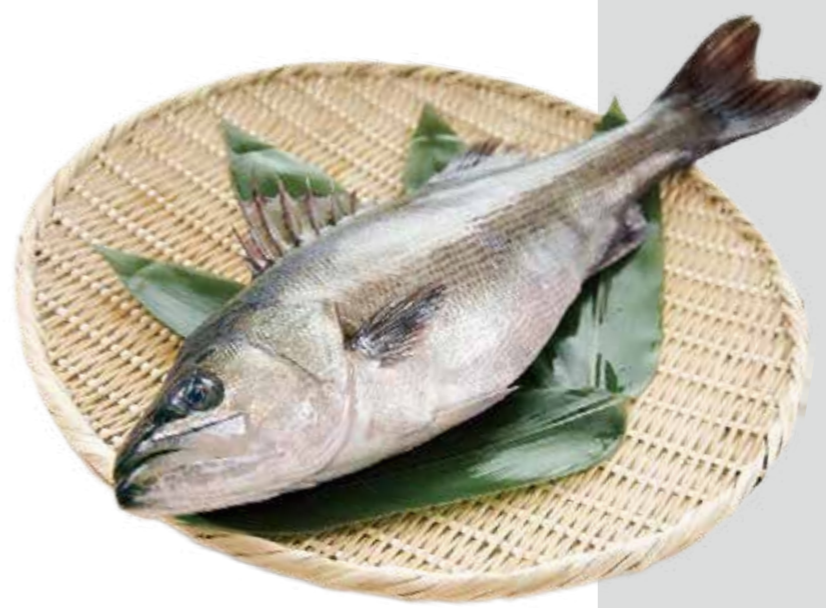
スズキ (撮影地: 横浜市漁業協同組合)

おすすめの食べ方 上品で淡泊な白身から薄切りのお刺身を氷水でさらす「洗い」が美味で有名ですが、ポアレやムニエルなど焼き料理、カルパッチョなどにも向きます。