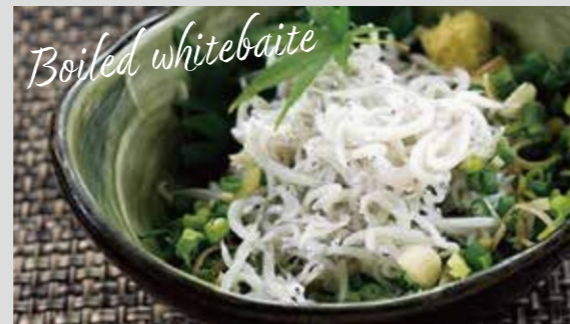
釜揚げシラス (撮影地: 平塚漁港の食堂)

おすすめの食べ方 新鮮な生シラスは生姜醤油が一般的ですが、オリーブオイルと塩をひとつまみかけて食べてもおいしいです。釜揚げシラスはそのまま食べても十分うまみを堪能できます。