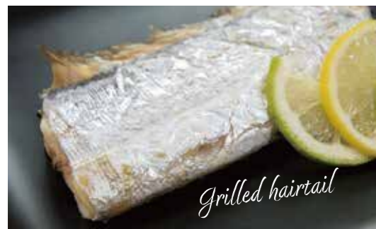
タチウオの塩焼き