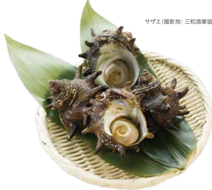
サザエ (撮影地: 三和漁業協同組合城ヶ島支所)