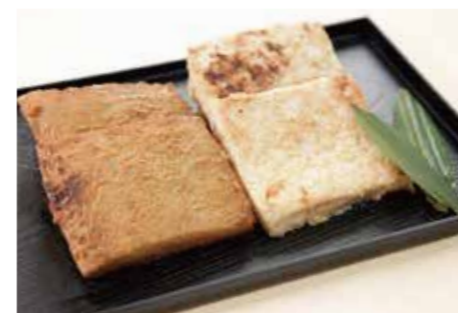
かじきの味噌漬・粕漬