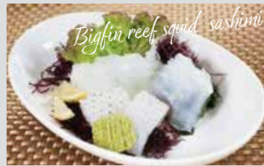
アオリイカの刺身 (撮影地: 平塚漁港の食堂)