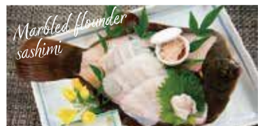
マコガレイのお造り