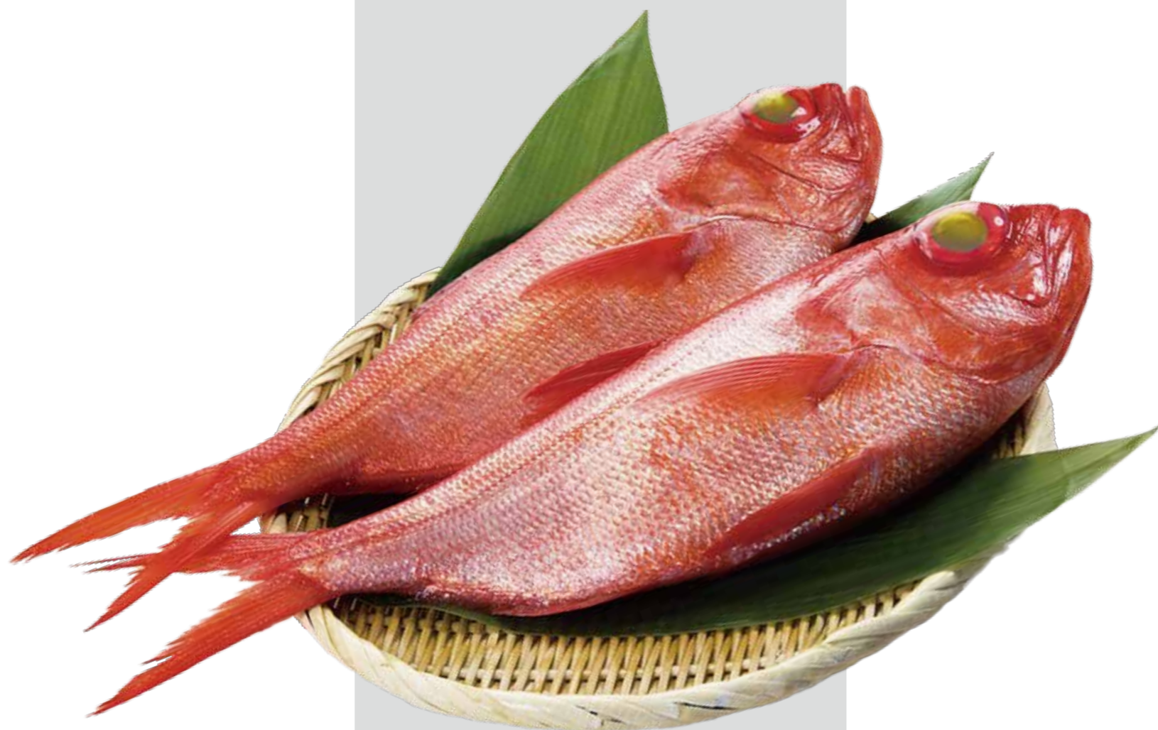
キンメダイ (撮影地: みうら漁業協同組合)