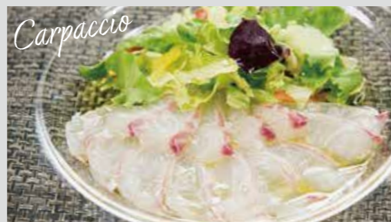
マダイのカルパッチョ

豆知識 タイ類の中でも、もっとも美味と言われる“魚の王様”。きれいな赤い体から縁起物としても珍重されます。また、クセのない白身魚で、小骨もありません。