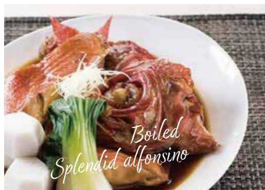
金目鯛の煮付け (撮影地: 地魚料理 松輪)