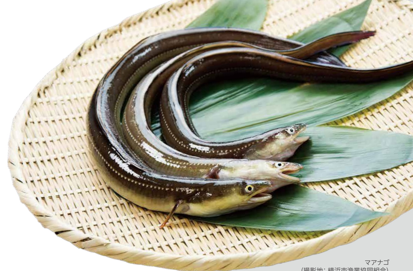
マアナゴ (撮影地: 横浜市漁業協同組合)