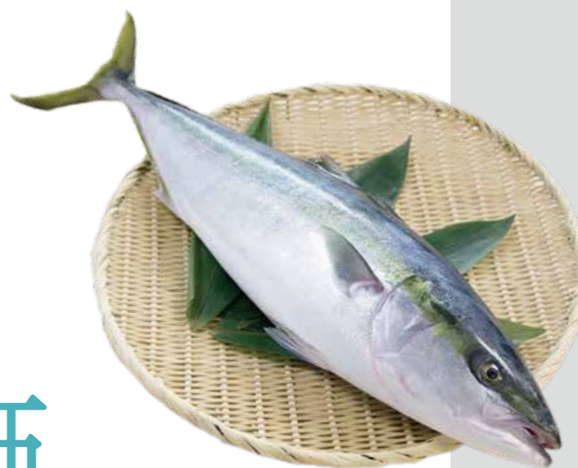
ブリ (撮影地: 小田原魚市場)