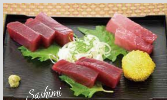
メバチの刺身(中トロ・赤身)

マグロには色々な種類がありますが、「三崎のまぐろ」で有名なのはメバチが中心で、遙か遠洋で獲れたもの。他にも相模湾沿岸では、クロマグロやキハダの若魚(メジ)が一本釣りや定置網で獲れます。