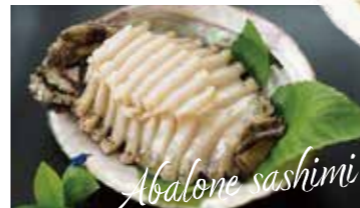
メガイアワビの刺身