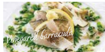
カマスの酢の物 (撮影地: 平塚漁港の食堂)