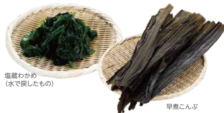
塩蔵わかめ (水で戻したもの)