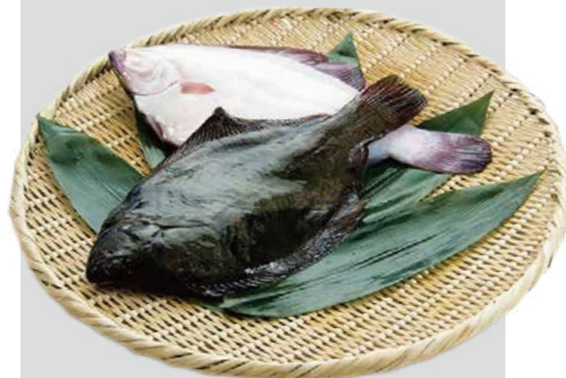
マコガレイ (撮影地: 横浜市漁業協同組合)