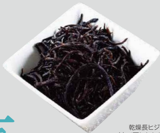
乾燥長ヒジキ (水で戻したもの)