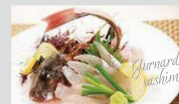
ホウボウのお造り (撮影地: 平塚漁港の食堂)