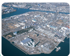
発電所から周辺事業所への蒸気供給

Committee for synergy in Keihin industrial complex