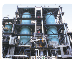
企業間で重質油分解装置を組み合わせた一体的運用