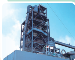
製鉄高炉スラグのセメントへの活用によるCO 2 排出抑制