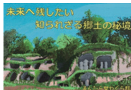
名越切通 まんだら堂やぐら群 (廻子市)