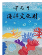
ウメボシイソギンチャク (真鶴町)