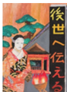
大山・薪能 (伊勢原市)