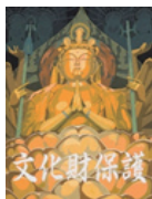
三十三間堂 千手観音坐像 (京都府京都市)