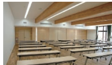
▲100人収容のレクチャールーム