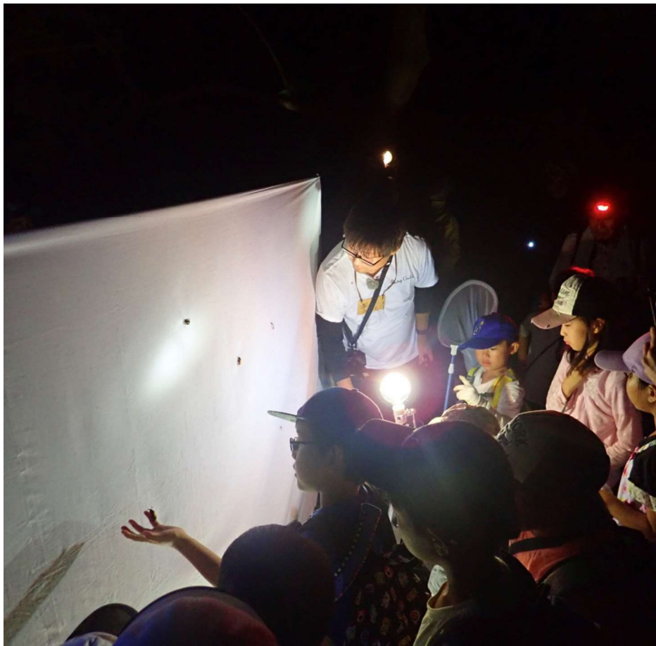
ライトトラップで虫を呼ぶ