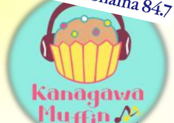
H30年11月3日放送予定 FMヨコハマ「カナガワ マフィン」