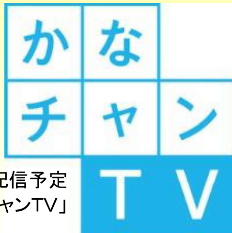
H30年10月下旬配信予定 神奈川県「かなチャンTV」