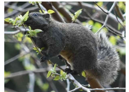
クリハラリス（「8700F」さん報告）