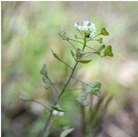
ナズナ （相模原市立博物館）