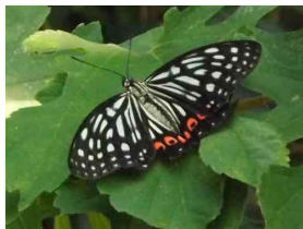
アカボシゴマダラ大陸亜種 （「たかおっち」さん報告）