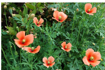
ナガミヒナゲシ （相模原市立博物館）