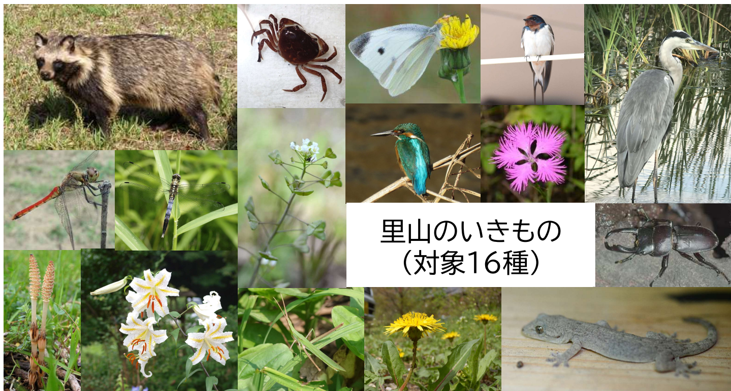
里山のいきもの (対象16種)