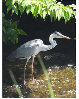
アオサギ （「河鹿蛙」さん報告）