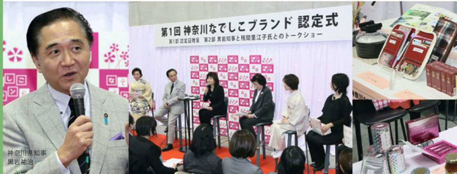
神奈川県知事 黒岩祐治