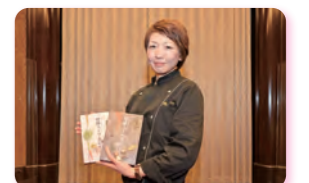
※2023認定商品の認定式の様子