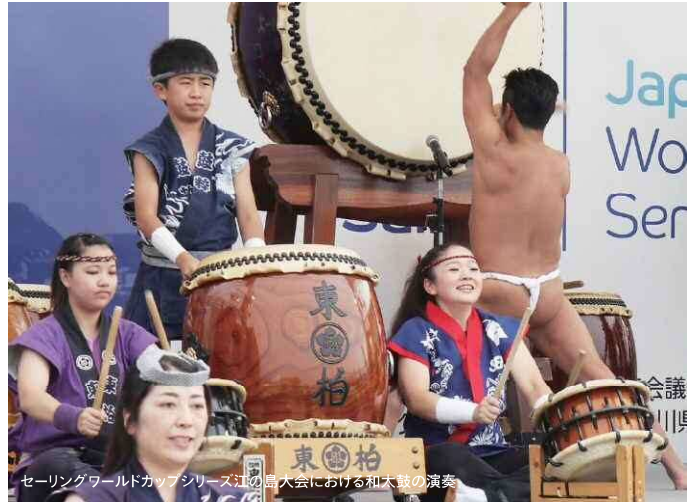
セーリングワールドカップシリーズ江の島大会における和太鼓の演奏

そこで、文化芸術の魅力で人を引きつけ、地域のにぎわいをつくり出す、マグカル(マグネット・カルチャー)の取組みのさらなる展開を図るとともに、笑いがあふれる社会の実現を後押しします。また、年齢や障がいなどにかかわらず、子どもから大人まで、あらゆる人の文化芸術活動の充実を図ることで、共生社会づくりに寄与するとともに、心豊かな県民生活の実現に向けて取り組みます。