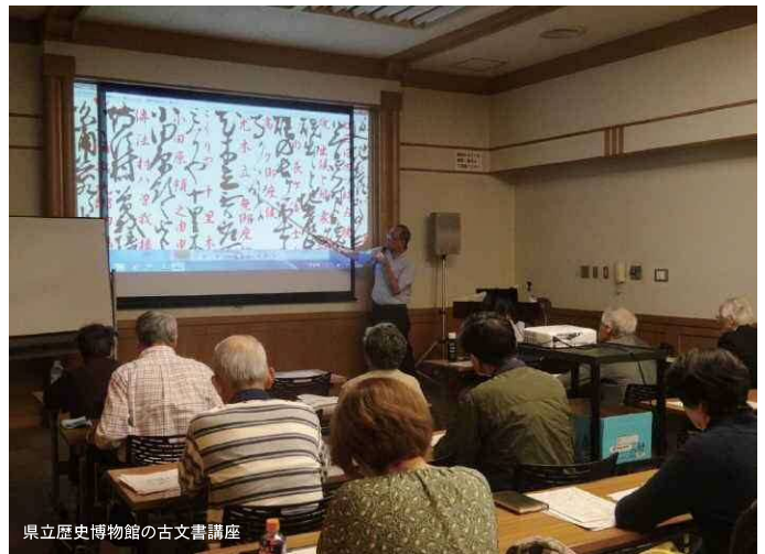
県立歴史博物館の古文書講座