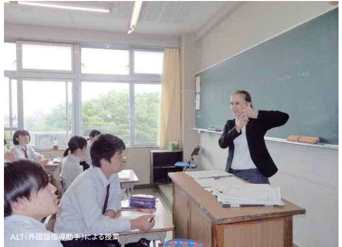
ALT(外国語指導助手)による授業

そこで、県立高校改革をはじめとした一人ひとりの「生きる力」を高める学校教育の充実、県民の生涯にわたる学びの機会の提供、学校などを核として地域におけるコミュニティの形成を図るなど学びを支える環境づくりに取り組み、生涯を通じたかながわの人づくりを進めます。