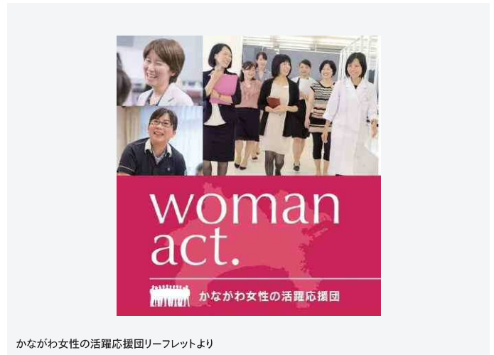
かながわ女性の活躍応援団リーフレットより

そこで、あらゆる分野における男女共同参画を一層進めるため、固定的な役割分担意識の解消や企業における働き方改革の取組みを促進するとともに、配偶者等からの暴力防止や、様々な困難を抱えた女性などに対する支援に取り組み、誰もが互いの人権を尊重し、性別にかかわらず、共に生き、共に参画し、笑ってらせる社会をめざします。