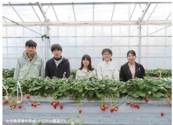
女性農業者の育成(かながわ農業アカデミー)