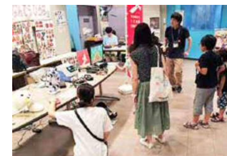
ロボット体験キャラバン

さがみ縦貫道路の沿線地域等を対象に生活支援ロボットの 実用化を図る地域活性化総合特区「さがみロボット産業特区」 (第2期計画)を推進し、ロボット関連の研究開発、実証実験、 関連産業の集積等を進めます。