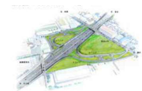
(仮称)綾瀬スマートインターチェンジ 概略イメージ図

リニア中央新幹線の建設促進やJR相模線複線化等の促進など 鉄道網の整備促進と、厚木秦野道路(国道246号バイパス) や県道46号(相模原茅ヶ崎)(上郷立体)の整備などの道路網 の整備を進めています。また、スマートインターチェンジの整 備促進など道路網の有効活用にも取り組みます。