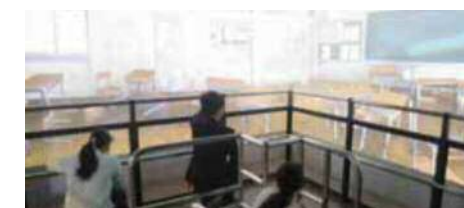
地震体験コーナー