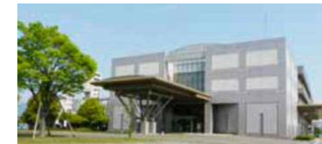
総合防災センター

総合防災センターの臨場感ある体験施設や防災シアターの 活用による県民の防災意識の向上を図ります。また、「かなが わ版ディザスターシティ(県消防学校の災害救助訓練施設)」 の活用などを通じて、防災関係機関の災害救助対応力の強 化を図ります。