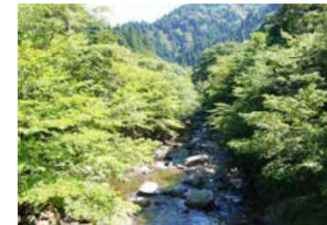
豊かな水を育む水源環境

水源の森林エリア(ダム水源などを保全するうえで重要な県内 の森林の区域)では、良質な水の安定的確保を目標に水源かん 養機能など森林の持つ公益的機能の向上を図るための森林 整備や、水源環境の負荷軽減を図るための生活排水対策を 進めます。