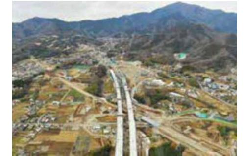
新東名高速道路 伊勢原大山インターチェンジ

新東名高速道路や横浜湘南道路及び厚木秦野道路(国道246号バイパス)などの整備促進や(都)湘南新道の整備などの道路網の整備を進めるとともに、スマートインターチェンジの整備促進など道路網の有効活用にも取り組みます。また、JR東海道本線の村岡新駅(仮称)の実現に向けて取り組みます。