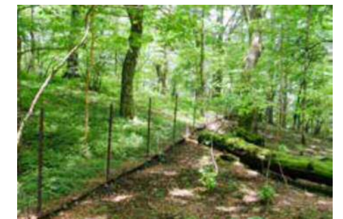
土壌保全対策による植生回復状況

丹沢大山では、植生保護柵の設置などの土壌保全対策やニホンジカの管理捕獲、これまでの技術開発の成果などを活用したブナ林の保全・再生対策、県民との連携・協働による登山道整備などを進めることで、自然の再生を図ります。