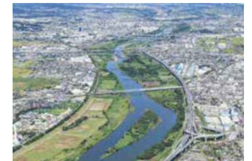
ツインシティ整備地区周辺の状況

再生可能エネルギーの導入など、環境共生モデル都市ツインシティを整備することで、魅力あるまちづくりを推進するとともに、全国や首都圏との交流連携の窓口となる東海道新幹線新駅を設置し、地域全体の活性化を図ります。