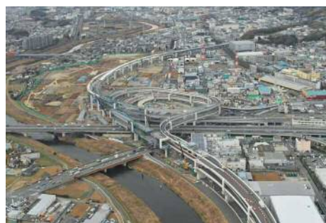
高速横浜環状北西線 横浜港北ジャンクション

都市と県内及び県外地域との連携を強化するため、相鉄線とJR線、東急線とを結ぶ神奈川東部方面線の整備により、鉄道網の整備を促進します。また、東名高速道路と第三京浜道路とを結ぶ高速横浜環状北西線や、圏央道の一部である高速横浜環状南線などの整備により、自動車専用道路網の整備を促進します。