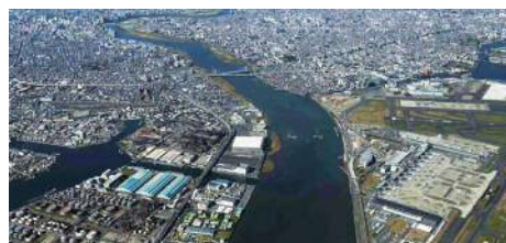
羽田空港と周辺地域

我が国の国際競争力を強化するとともに、県内経済の活性化や県民の利便性の向上につなげるため、羽田空港の機能強化の促進を図るとともに、川崎市殿町地区と対岸の大田区を結ぶ橋りょう(羽田連絡道路)の整備促進など羽田空港の国際化を生かしたまちづくりに取り組みます。