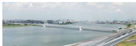
羽田連絡道路(完成イメージ)