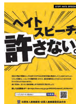
ポスター 「ハイトスピーチ、許さない」