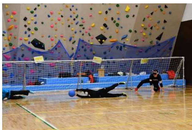
障がい者スポーツ教室 (ゴールボール)