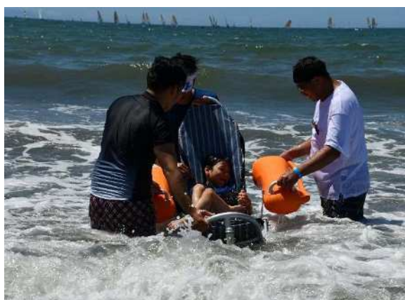
かながわバリアフリービーチ (海水浴の体験)