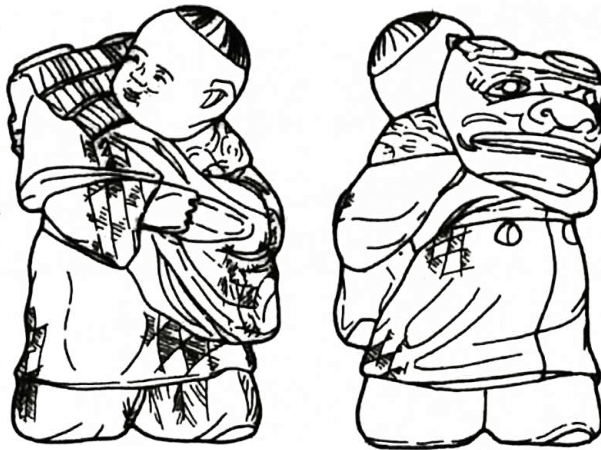
獅子を背負う男性