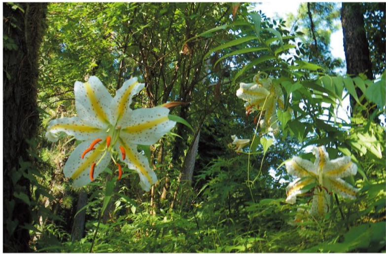
神奈川県の花 やまゆり