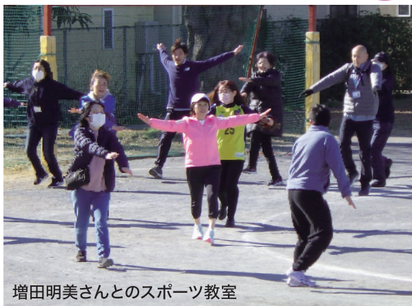
増田明美さんとのスポーツ教室