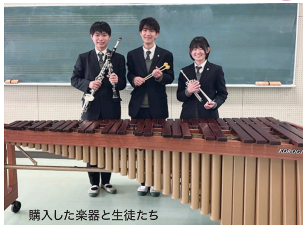
購入した楽器と生徒たち