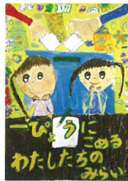
海老名市立海老名小学校2年 戸床 優希