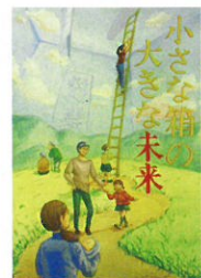
県立弥栄高等学校2年 藪馬 みのり