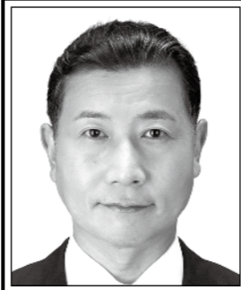
よしかず たるい 良和 元衆議院議員 表現の自由を守る。 日本V字回復やっつる!