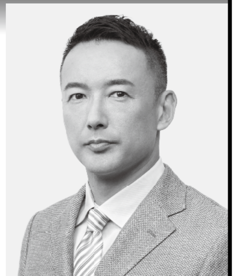
れいわ新選組 代表