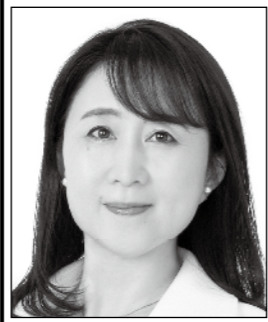
やた わか子 国民民主党 副代表 あなたと動けば、 未来は変わる。