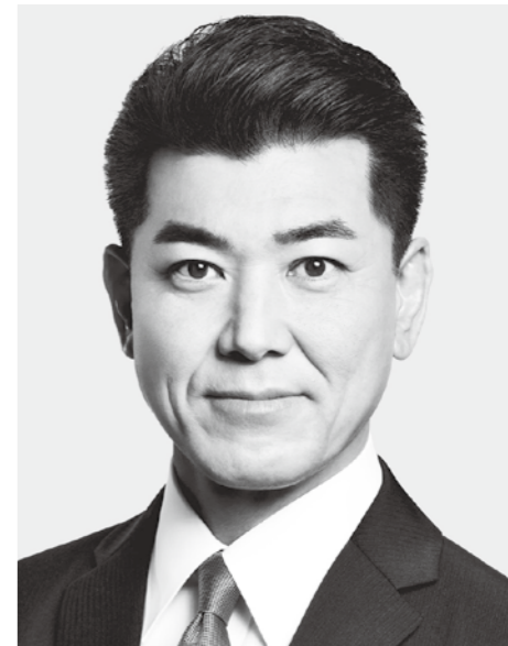
立憲民主党 代表 泉 健太