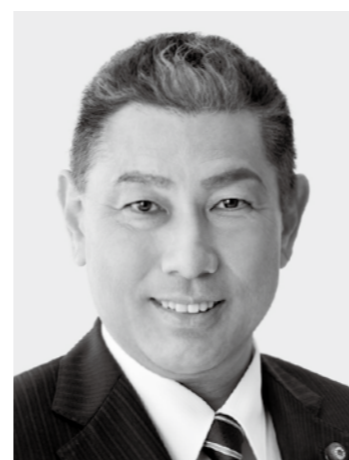
くまの せいし 現1 前農林水産大臣政務官。愛媛大学大学院博士課程修了。医学博士。放射線科専門医。57歳。