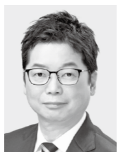
石橋 みちひろ 参議院議員 現・57