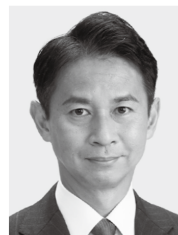
たに あい 正明 現3 元農林水産副大臣、党参議院幹事長。京都大学大学院修士課程修了。49歳。