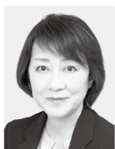
さわむらけいこ フリーアナウンサー 新・59