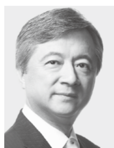
白しんくん 参議院議員 現・63