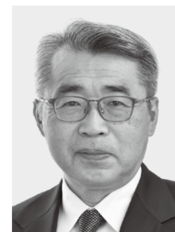
みやざき まさる 現1 前環境大臣政務官。党環境部会長。埼玉大学工学部卒。64歳。