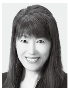
はたともしこ 薬剤師・元参議院議員 心を燃やせ!カジノ阻止。 ワクチンより検査! 元・55