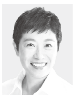
つじもと 清美 元国土交通副大臣 最後の歯止め 新・62