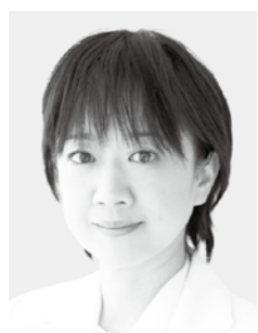
青木 愛 参議院議員 現・56