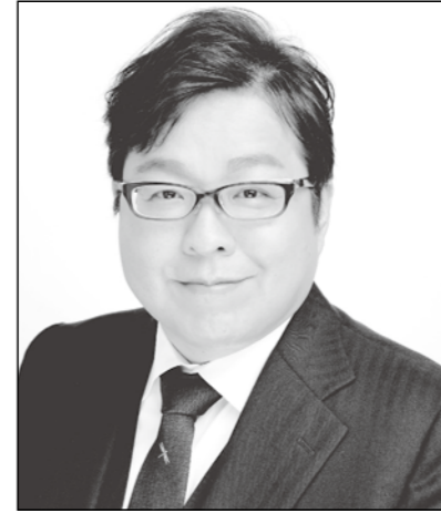
さくらい まこと 党首 桜井 誠