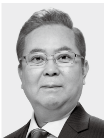
よこやま 信一 現2 前復興副大臣。北海道大学大学院博士課程単位取得。水産学博士。62歳。

公明党はこの7人をはじめ参院選比例区に17人を公認しています。 ※年齢は選挙期日現在