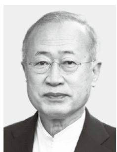
有田 芳生 参議院議員 現・70