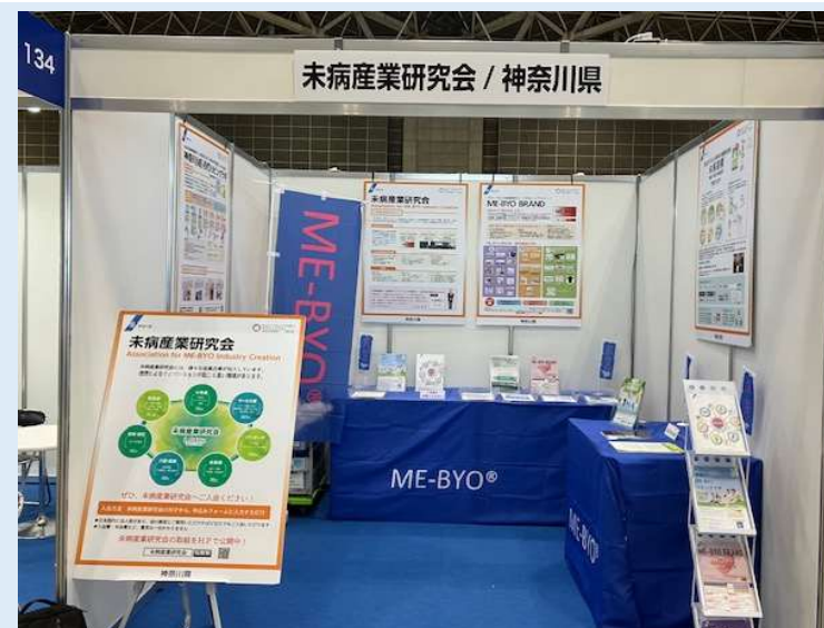
(研究会ブースイメージ)