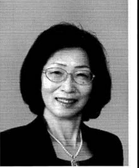
最高裁判所判事 鬼丸かおる 昭和二十四年二月七日生