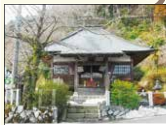
スタート地点の地蔵堂