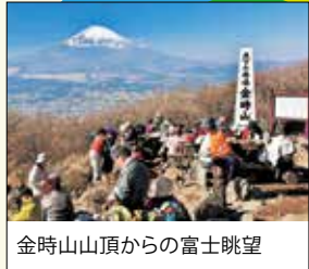
金時山山頂からの富士眺望