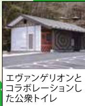
エヴァンゲリオンとコラボレーションした公衆トイレ

4 夕日の滝分岐(猪鼻岩) 登山の思い出に、「猪鼻岩」付近に設置したフォトプロップス(記念撮影用小道具)を使用して、記念写真を撮ろう!自分の顔をはめての撮影もよし、お気に入りのギアを入れたの撮影もよし、自分なりの撮影を楽しもう!